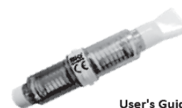
User's Guide Guide d'utilisation (사용설명서)